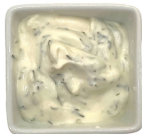
Шар - Шар