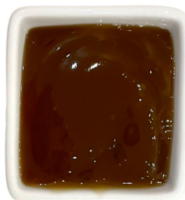
Кисло - сладкий